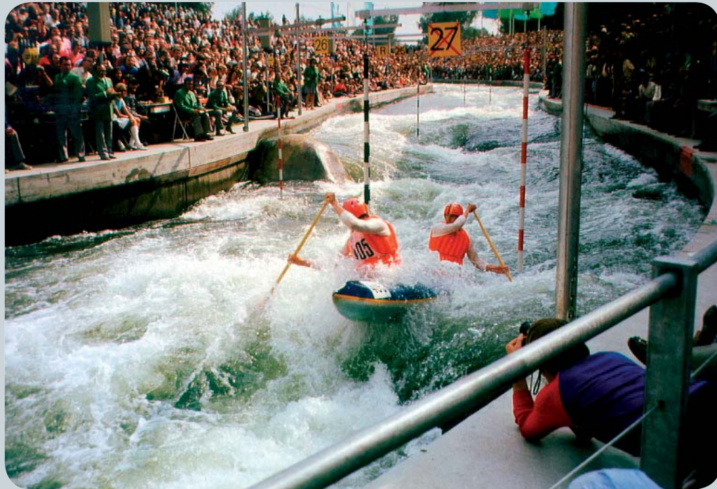
Olympische Sommerspiele 1972 am Augsburger Eiskanal – ein Zweier Canadier auf der Strecke

Seit 1949 finden jährlich (außer in Olympiajahren) Kanuslalom-Weltmeisterschaften statt. Bis heute war Augsburg bereits dreimal (1957, 1985 und 2003) Austragungsort. Absoluter Höhepunkt waren aber die Olympischen Spiele 1972. Auf dem extra